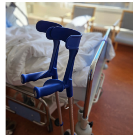
Treppensteigen mit Krücken gehört zum Trainingsprogramm bei einer Knie-Vollprothese.

Nachdem alle erforderlichen Voruntersuchungen und das Infogespräch beim Prästationären Ambulatorium im Kantonsspital absolviert sind, ist es endlich so weit.