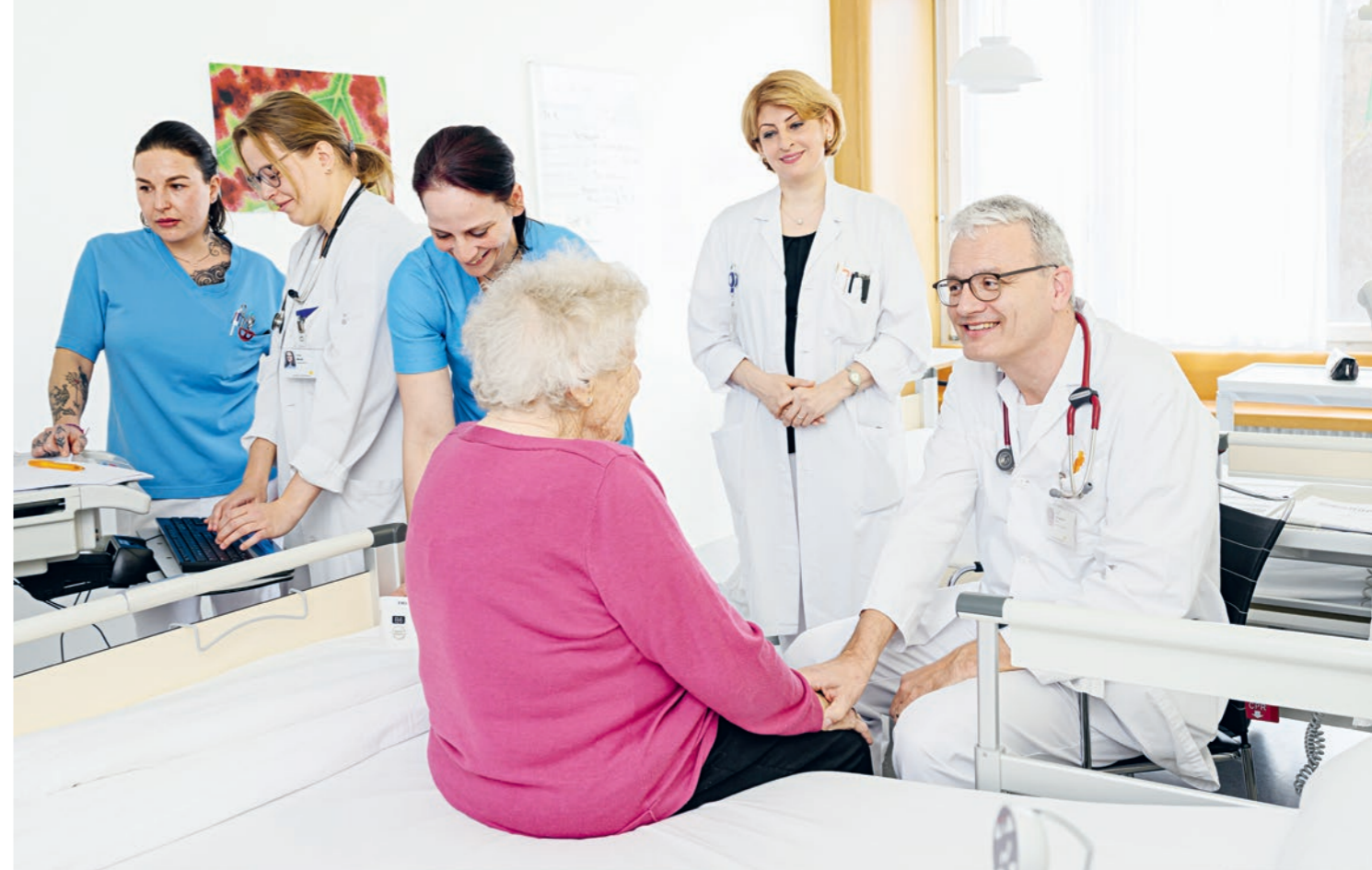
Bei uns können Sie auf Empathie und Kompetenz zählen.

Neben einer qualitativ hochwertigen medizinischen Versorgung bemühen wir uns, die Therapien, wo immer möglich, Ihren individuellen Bedürfnissen und Wünschen anzupassen.