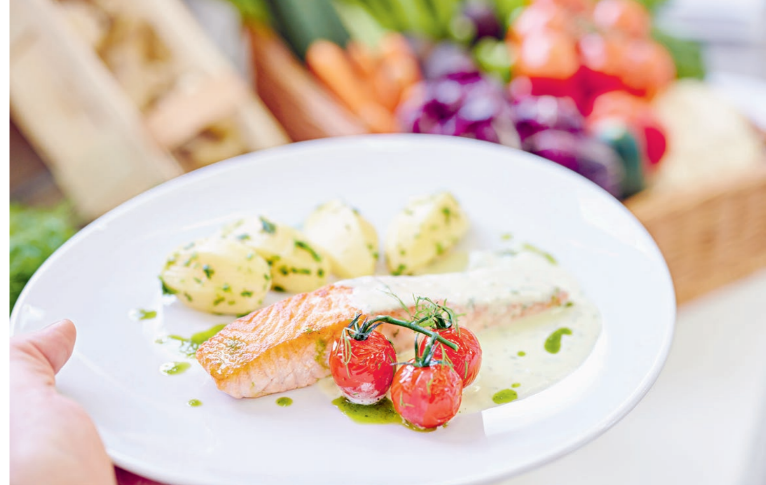
Eine Freude für Augen und Magen: bekömmliche Speisen.

Gesundheit geht durch den Magen. Unsere Küche weiss das und bereitet die Speisen abwechslungsreich und mit Liebe zu.