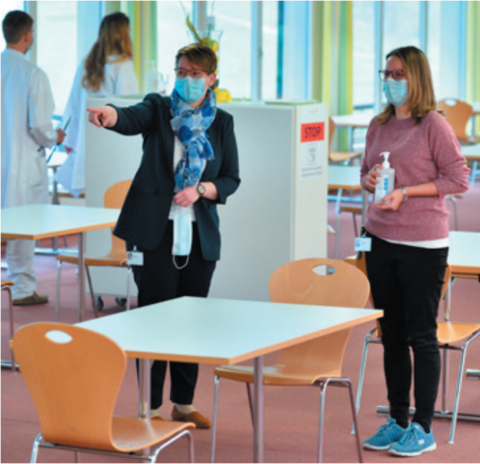
Im Personalrestaurant setzte das Hotellerie-Team diverse Schutzmassnahmen für Mitarbeitende um.