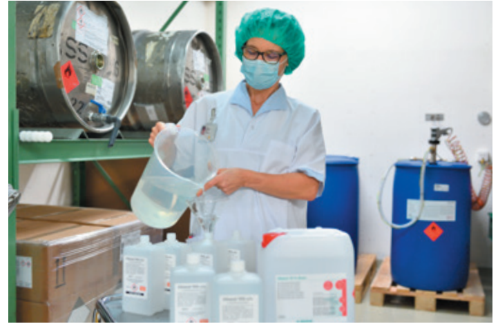
Abfüllen von Desinfektionsmittel in der Spitalapotheke.