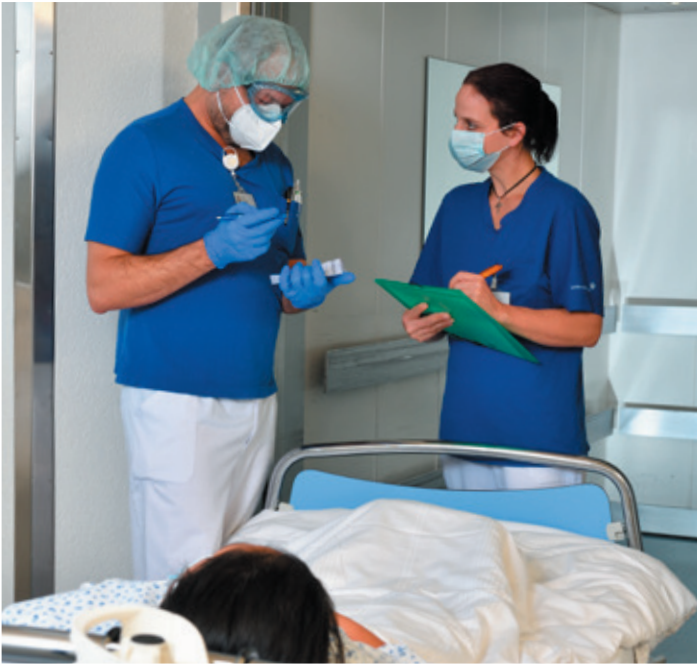
Nach überstandener Covid-Infektion: Direkt beim Aufzug der Station erfolgt die Übergabe einer Patientin, die von der Isolationsstation auf eine Nicht-Covid-Station verlegt werden kann.