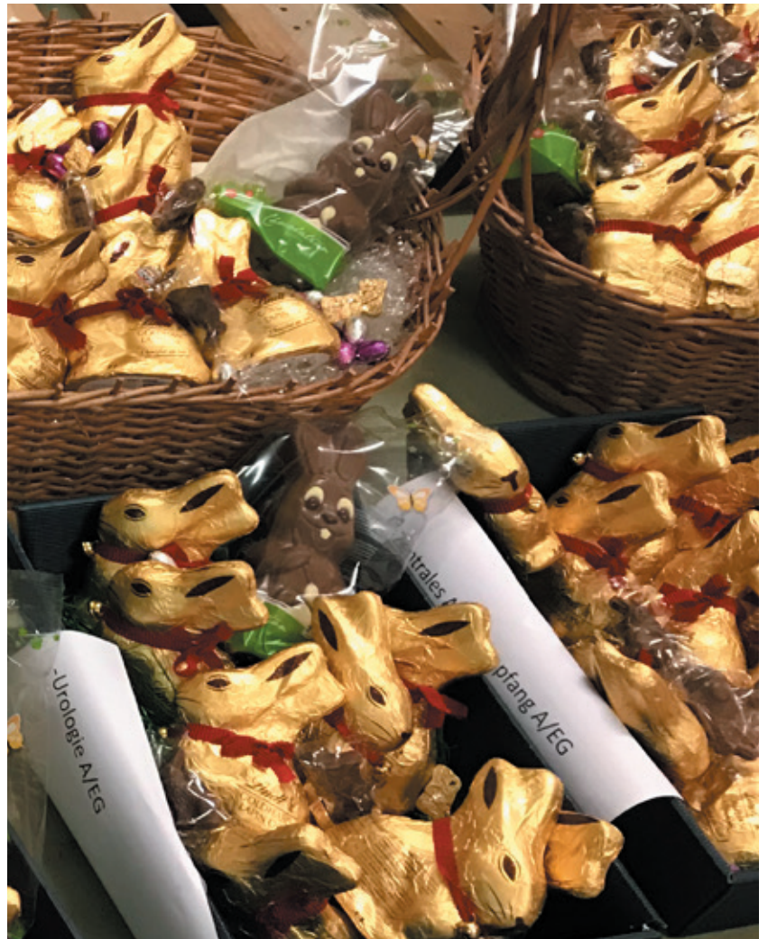
Grosse Solidarität: Süsse Geschenke von Unternehmen für die Mitarbeitenden der Spitäler Schaffhausen an Ostern 2020.

Die Pandemie hatte und hat Einfluss auf alle möglichen Bereiche der Spitäler Schaffhausen: Ärzten/-innen und Pflegefachpersonen, die Covid-Patienten/-innen direkt betreuen und behandeln und eigentlich auf anderen Stationen oder zum Beispiel im Operationssaal arbeiten. Das Labor, das eine Vielzahl an Covid-Tests analysiert. Die Spitalapotheke, die eine Unmenge an Medikamenten vorbereitet. Mitarbeitende der Hotellerie, die Zutrittskontrollen durchführen und denen manchmal mit Unverständnis oder gar Unwillen begegnet wird. Die Pneumologie und Therapien, wo Covid-Patienten/-innen auch nach überstandener akuter Erkrankung teilweise nachbetreut werden müssen. Dies sind nur ein paar wenige Beispiele – die Mitarbeitenden der Spitäler Schaffhausen haben im Jahr 2020 Aussergewöhnliches geleistet. Die Pandemie war belastend und allgegenwärtig, sowohl im privaten als auch im beruflichen Umfeld. In diesen intensiven und unsicheren Monaten spürten wir aber auch grosse Hilfsbereitschaft und Dankbarkeit aus der Bevölkerung, von Firmen, Vereinen, Schulen usw. Die eingehenden Mails, Briefe und Geschenke taten gut. Die Solidaritätsaktionen haben uns bewegt, und die Wertschätzung gab Energie für die weitere gemeinsame Bewältigung der Pandemie.