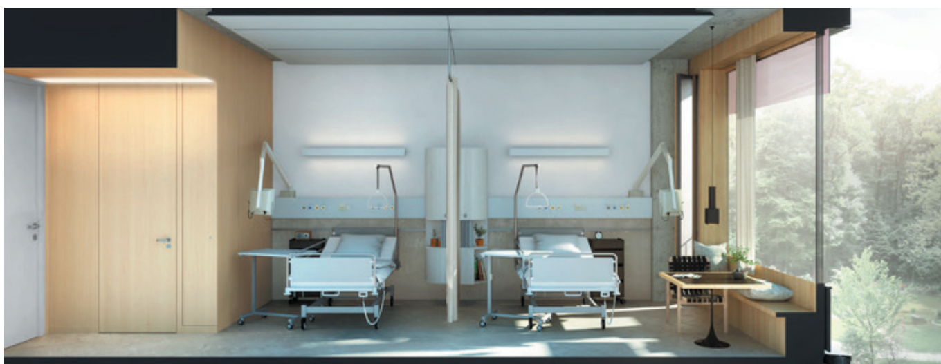
Blick in ein Patientenzimmer.