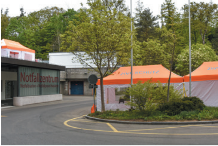
Patienten-Vor-Triage vor der Notfallstation und Zutrittskontrollen im Frühjahr 2020 – der Zivilschutz im Einsatz am Kantonsspital.