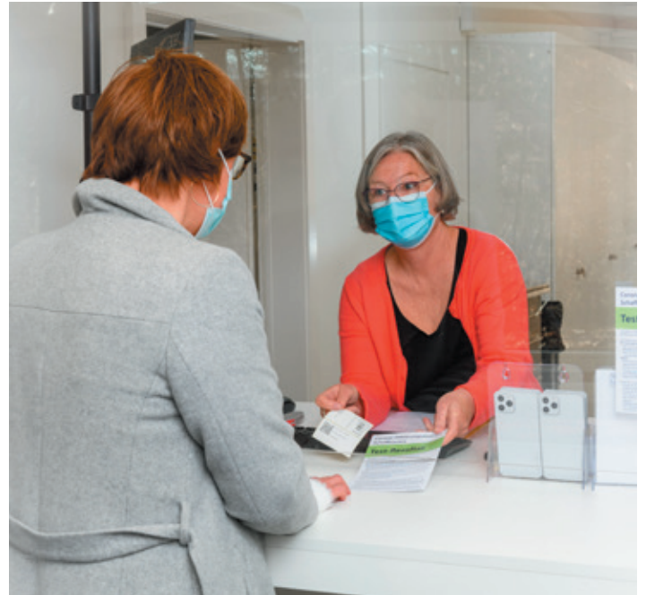
Empfang und Aufklärung zum Corona-Test im Kantonalen Abklärungszentrum.